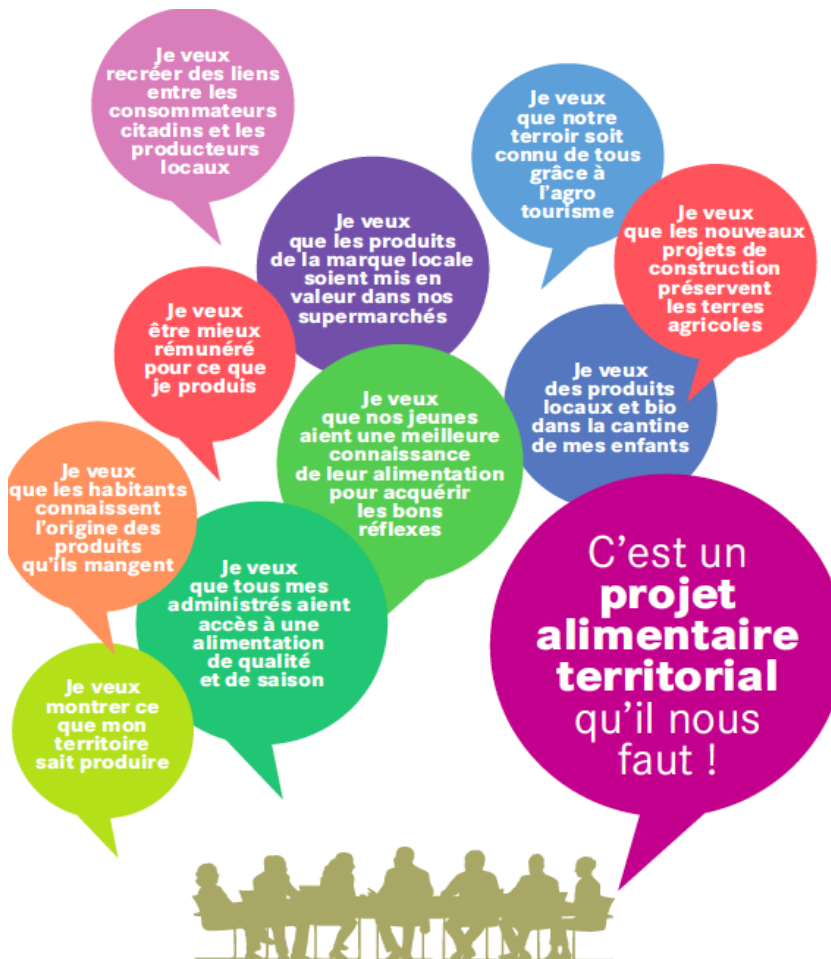
Figure 2 : les PAT, des projets de territoire aux multiples entrées alimentaires

cas à aller au plus simple sans toujours toucher au plus essentiel ou au plus englobant. C'est ainsi qu'on a pu voir des propositions se présentant comme PAT, qui visent simplement à assurer l'approvisionnement d'une cantine en produits locaux, ou l'ouverture d'un magasin de producteurs. Certains projets retenus au titre du PNA entretiennent donc l'ambiguïté quant à la nature de la dimension véritablement territoriale des PAT.